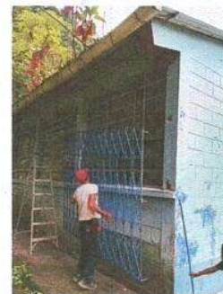
Foto 6: Fabricación e instalación de balcones de hierro en ventanas

Observación: Si es necesario se pueden agregar fotos adicionales y actualizar el número de hojas.