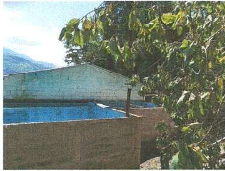
Foto 1: Sustitución de lámina por lámina troquelada aluzinc calibre 26